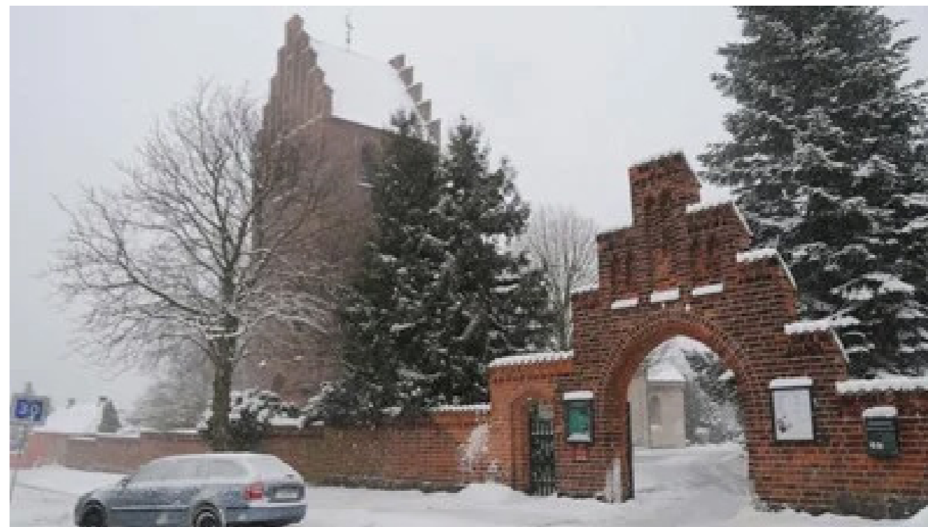
Brønshøj kirke dækket i sne

Lige nu her i december 2023, har vejret været meget svingende. Der har dog kun faldet en lille smule sne. Flere håber at det bliver en landsdækkende hvid jul. Chancen for det er 7 procent. Det er lidt ærgerligt for 10 ud af 10 børn fra Brønshøj skole, vil gerne have en hvid jul i år. På de sidste 123 år har der kun været landsdækkende hvid jul hele 9 gange. Det udtaler DR sig om, og derfor bliver det nok ikke hvid jul i år. Dine forældre har sikkert fortalt dig om, at de havde mere sne og frost, da de var børn og for en gangs skyld har de ret. Der er blevet cirka en grad varmere i Danmark i løbet af de sidste 30 år. Og den ene grad gør, at sommeren er blevet varmere og tørrere. Men derimod er vinteren er blevet