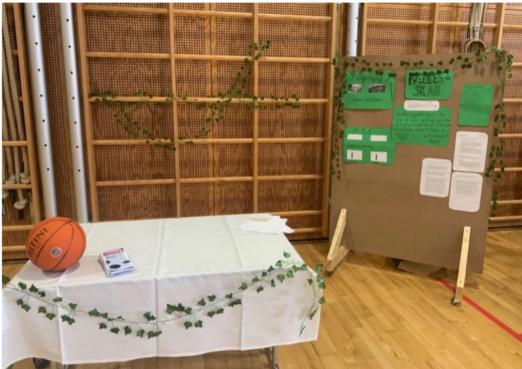
Projekt opgave bod fra 8 årgang 2022/2023

Da jeg spurgte om, hvad hun mente om dette års emne, lyste hendes øjne op, og hun fortalte følgende: Da vi fik at vide at vi skulle have om unge i Danmark, kan jeg godt afsløre at jeg blev glad. Hun forklarede at hun sidste år havde syntes, at emnet havde været meget lukket. Hun mener, at de nærmest fik serveret deres problemstilling fra start.