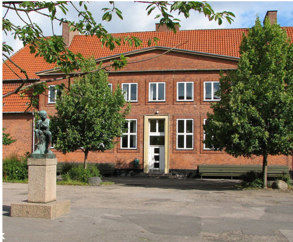
Af Luna, 9B

I Rødovre kommune går man en ny virkelighed i møde: Fjernundervisning bliver nu en realitet igen, vikarer skal spares væk, og der må ikke komme nye lærere overhovedet. Man skulle næsten tro, de var blevet ramt af en Covid-agtig krise igen, men nej – det er kommunale besparelser, som er på spil. Vi drejer fokuset væk fra Brønshøj et øjeblik og stiller skarpt på vores nabokommune, og hvordan de håndterer denne nye situation.